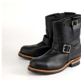
山下健二郎着用モデル