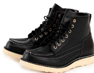
今市隆二着用モデル D-4121 BLACK 25,200 円（税込）