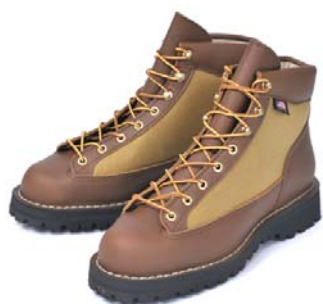
登坂広臣着用モデル D-3042 KHAKI 44,100 円（税込）