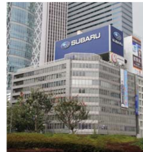
新宿スバルビル Shinjuku Subaru Building

Rental income : approx. 1.3 billion yen (FY2011: approx. 1.2 billion yen)